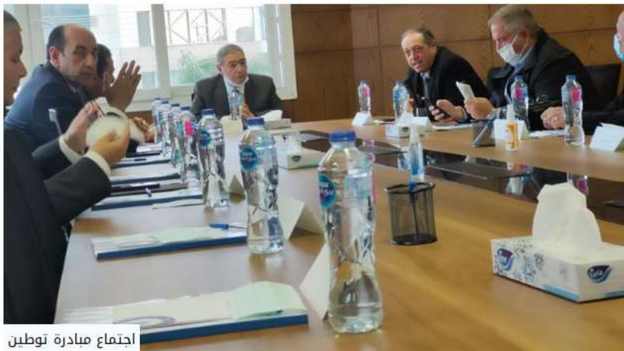
اجتماع مبادرة توطين