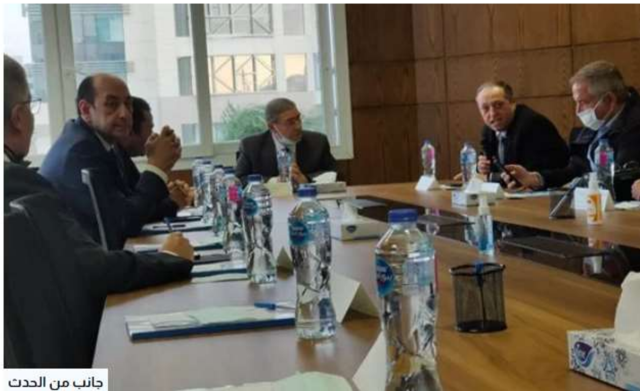
جانب من الحدث